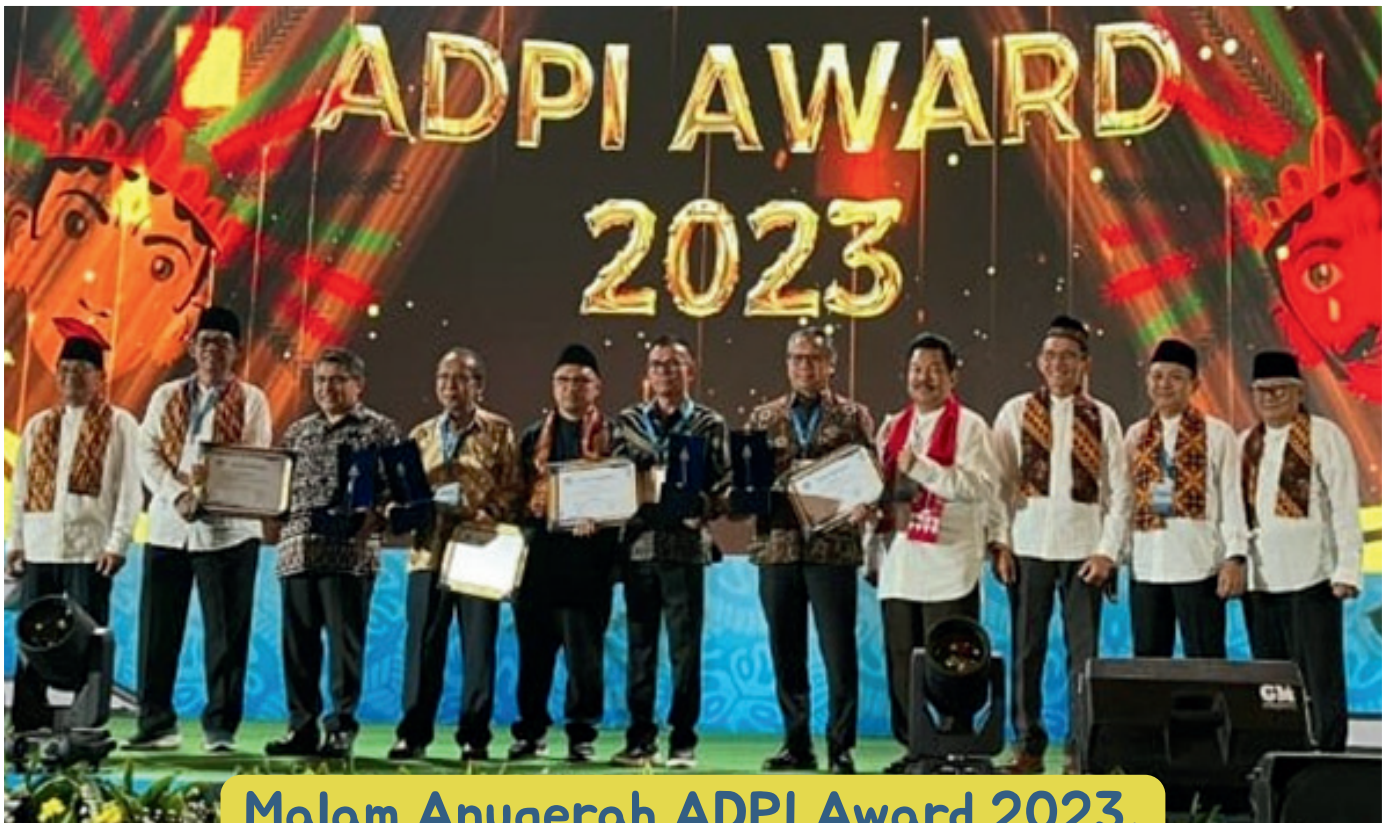
Malam Anugerah ADPI Award 2023, 03 September 2024