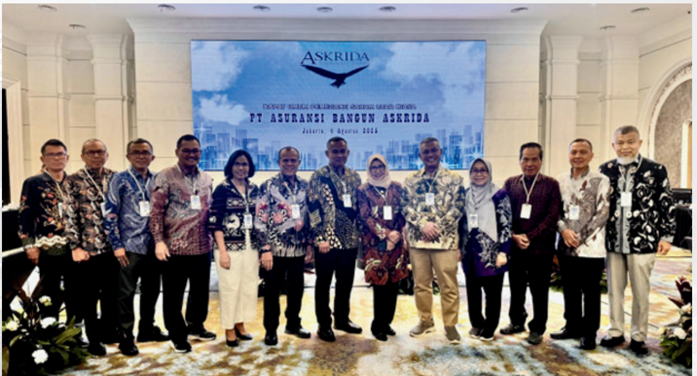
Rapat Umum Pemegang Saham ASKRIDA Tahun 2025 Jakarta