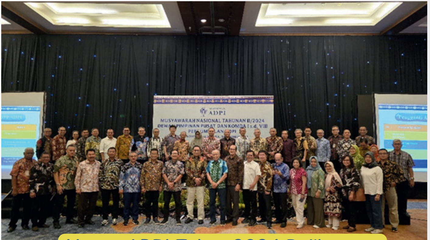
Munas ADPI Tahun 2024 Balikpapan