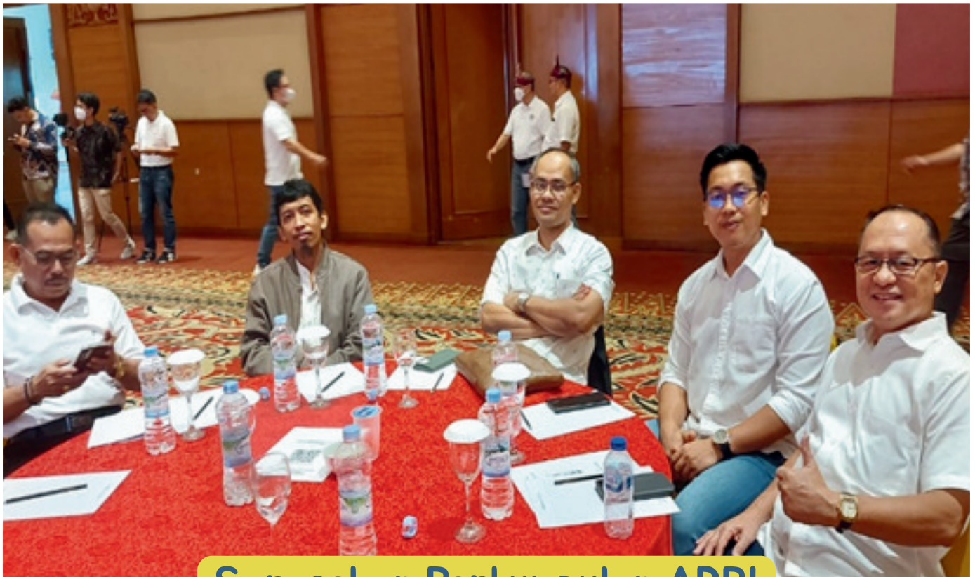
Sarasehan Perkumpulan ADPI