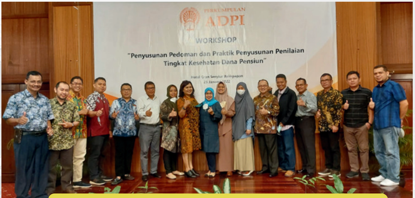
Workshop Manajemen Risiko Dana Pensiun

Dimana iuran tambahan tersebut untuk melunasi defisit masa kerja lalu yang terjadi karena adanya komitmen pendiri pada saat pendirian Dana Pensiun untuk mensejahterakan pegawainya sampai dengan masa pensiun dimana sejak berdiri Dana Pensiun telah memiliki peserta pensiun yang wajib diberikan manfaat tanpa ada pembayaran iuran sebelumnya, sehingga terjadi defisit masa kerja lalu atas 45 orang pensiun dipercepat pada saat pendirian tersebut.